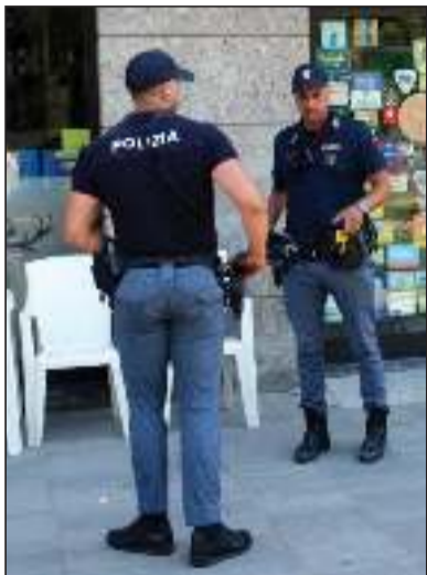
lineare il quadro dell'accaduto. L'episodio si è verificato nella giornata di sabato 4 luglio davanti a un locale della zona

MILANO Un episodio di estrema violenza ha scosso Milano, dove un uomo di 55 anni è stato accoltellato all'esterno di un bar nella zona di San Siro. Per l'aggressione è stato arrestato un cittadino ivoriano di 22 anni, fermato grazie all'intervento dei presenti che gli hanno impedito di allontanarsi prima dell'arrivo delle forze dell'ordine. Secondo quanto emerso nelle prime fasi delle indagini, il giovane dovrà rispondere dell'accusa di tentato omicidio. A colpire gli investigatori, oltre alla brutalità dell'episodio, sono state soprattutto le dichiarazioni pronunciate dal presunto aggressore subito dopo l'arresto. Una volta accompagnato dagli agenti di polizia, il 22enne avrebbe infatti pronunciato parole che hanno suscitato particolare sconcerto: avrebbe detto di essersi divertito durante l'aggressione e di essere disposto a ripetere un gesto analogo una volta tornato in libertà. Frasi che sono ora al vaglio degli inquirenti e che contribuiscono a de-