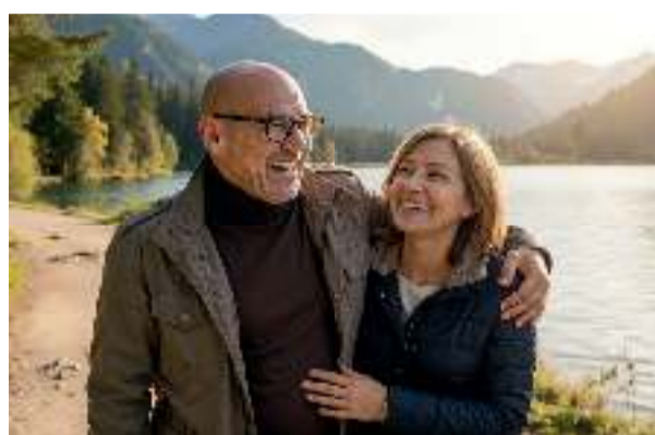
Goditi la tua vita relazionale con una virilità rafforzata

spermatogenesi ossia alla formazione dello sperma maschile. L'acido folico, a sua volta, promuove il normale metabolismo dell'omocisteina, fondamentale affinché i suoi livelli non raggiungano valori elevati tali da poter causare, tra l'altro, vasocostrizione. Anche la perfusione sanguigna e la trasmissione degli stimoli sono fattori importanti che influenzano la vita sessuale. Il sistema nervoso è responsabile della percezione e della trasmissione degli stimoli, compresi quelli sessuali: li riceve e li trasmette. È qui che entra in gioco il magnesio, che favorisce il normale funzionamento del sistema nervoso, contribuendo a ridurre inoltre stanchezza e astenia. A differenza di molti altri composti, Neradin può essere consumato in qualsiasi momento, così da non compromettere l'atteggiamento disinvolto, che nei momenti di intimità è la cosa più importante. Neradin è inoltre ben tollerata e pensato appositamente per l'assunzione quotidiana, in modo da garantire un apporto continuativo dei micronutrienti essenziali.