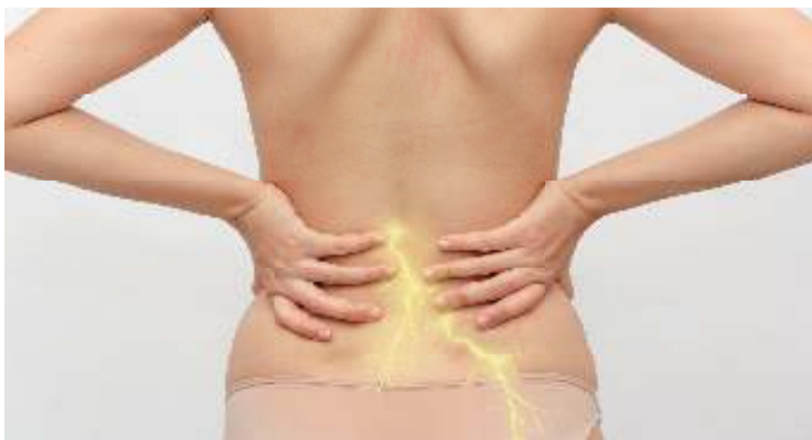
Fastidi nella zona glutea? Spesso la causa è da ricondurre al nervo sciatico.

Siete costantemente alle prese con fastidi alla schiena? Non siete gli unici. Ma quello che molti non sanno è che spesso la causa è da ricercare nei nervi. I ricercatori hanno scoperto che per la salute dei nervi sono essenziali dei micronutrienti speciali, contenuti ora in un nuovo complesso nutritivo unico nel suo genere (Mavosten, in farmacia).