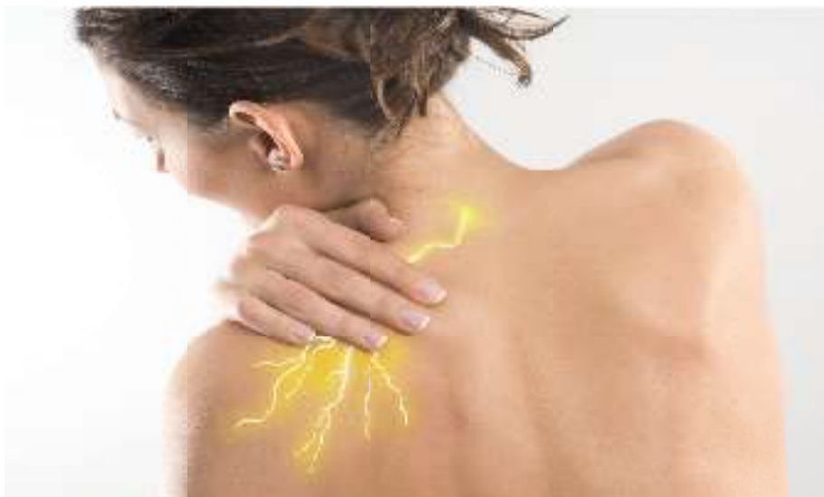
Fastidi alla schiena o al collo? Spesso la causa è da ricercare nei nervi

I ricercatori hanno sviluppato un complesso nutritivo unico