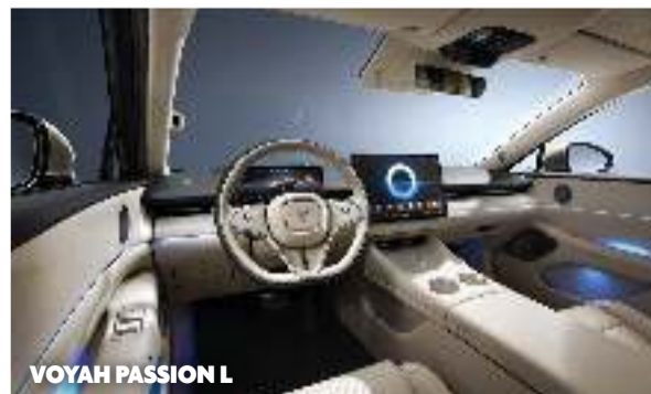
VOYAH PASSION L

una moderna espressione di artigianalità e prestigio. Theory 1 non è in vendita. Si tratta di una concept-car che funge da "canovaccio" per i programmi di ricerca e sviluppo nel design Lotus e per le progettive le ispirazioni, in termini di tecnologia e innovazione, che il brand inglese di proprietà del colosso orientale Geely intende implementare in futuro in tutta la sua gamma di prodotti.