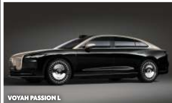
VOYAH PASSION L