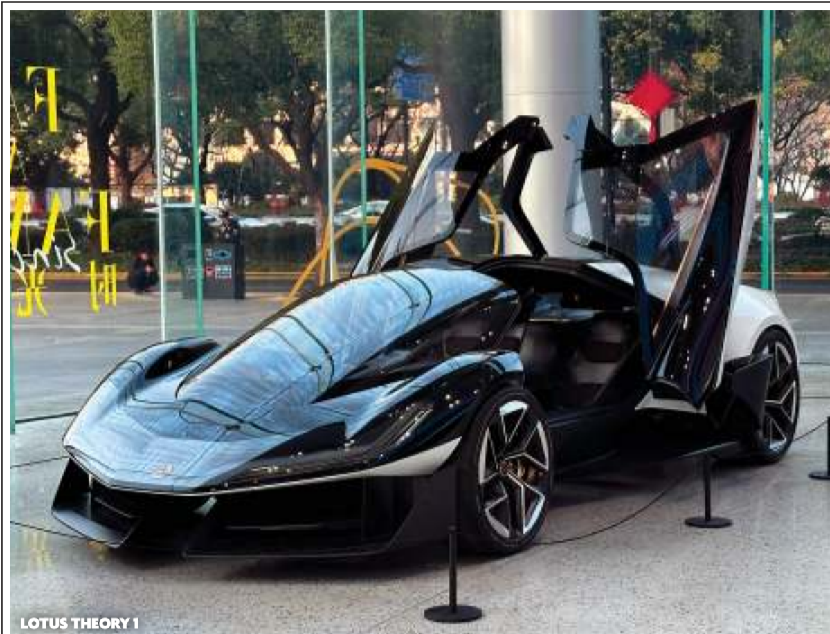
LOTUS THEORY 1