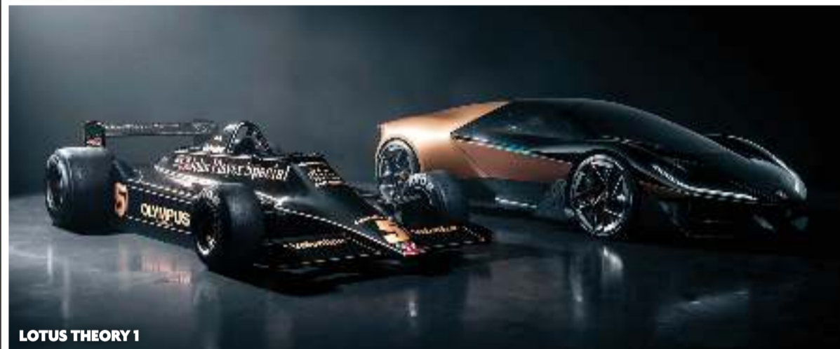
LOTUS THEORY 1